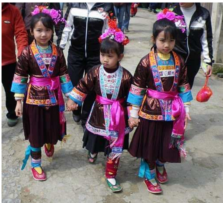
Petites filles Miao en costumes traditionnels

Merci pour votre soutien et votre présence à leurs côtés.